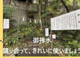
御神水 譲り合って、きれいに使いましょう