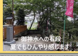
御神水への石段 夏でもひんやり感じます