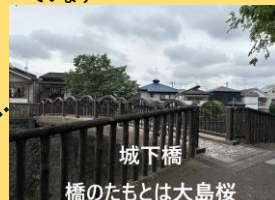
城下橋 橋のたもとは大島桜