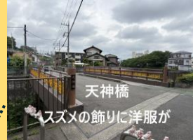
天神橋 スズメの飾りに洋服が