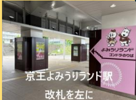
京王よみうりランド駅 改札を左に