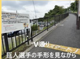
V通り 巨人選手の手形を見ながら