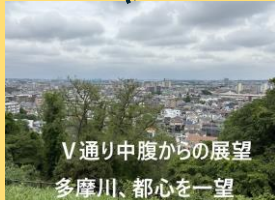
V通り中腹からの展望 多摩川、都心を一望