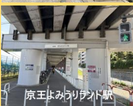
京王よみうりランド駅