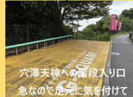
穴澤天神への階段入り口 急なので足元に気を付けて