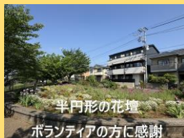
平円形の花壇 ボランティアの方に感謝