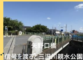
矢野口橋 信号を渡ると三沢川親水公園