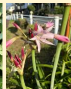
06-08クリナムパウエリー